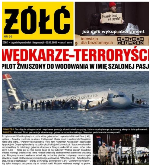
Rysunek: „Żółć. Pomówienia i insynuacje” (2007-2009) 5