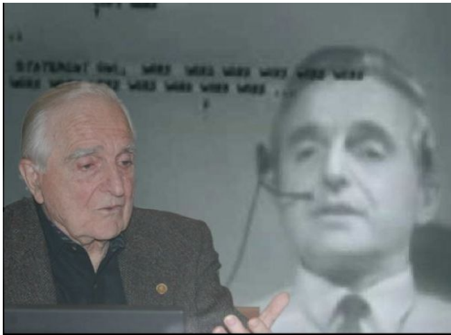
Doug Engelbart (1925-2013)