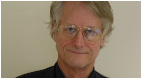
Ted Nelson (1937-)