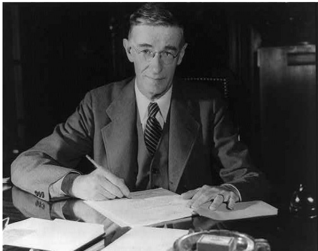
Vannevar Bush (1890-1974)