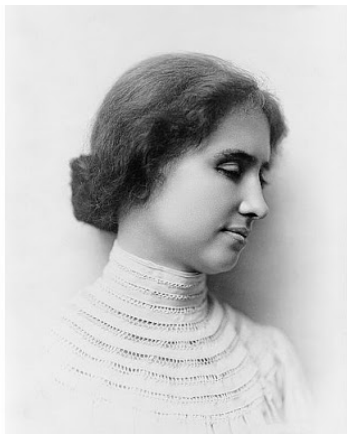
Laura Bridgman (1829-1889), Hellen Keller (1880-1968)