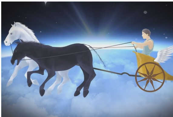
Platon, Fajdros (370 r.pne) — metafora rydwanu