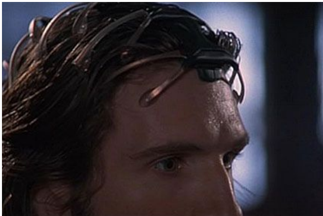
The wire — Kathryn Bigelow, Strange days (1995)