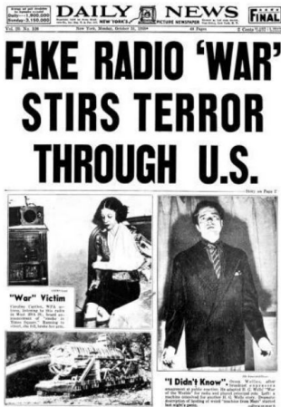
New York Daily News front page from Oct. 31, 1938.